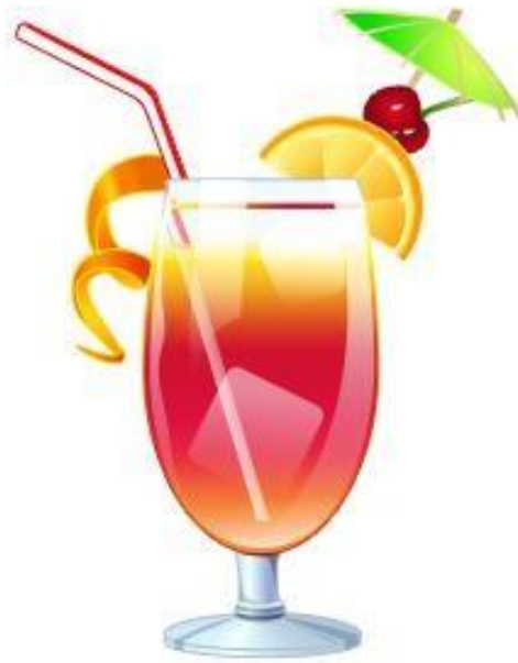
Cóctel Red Sombrero (zumo de piña, zumo de naranja, zumo de limón y granadina)