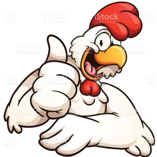
Carne de buey / Carne de pollo