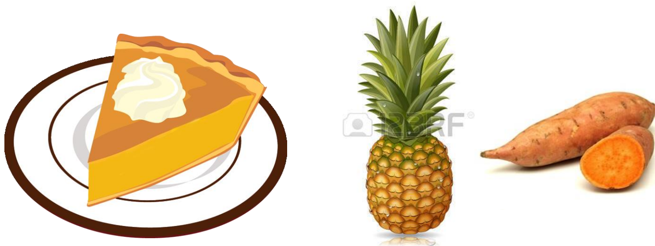
Pastel de camote y piña