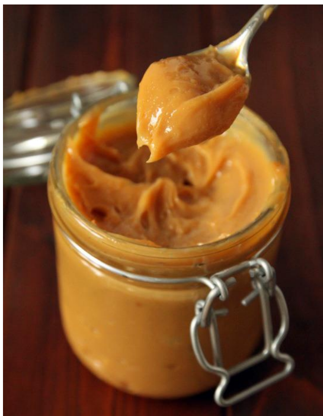
Natilla de cajeta