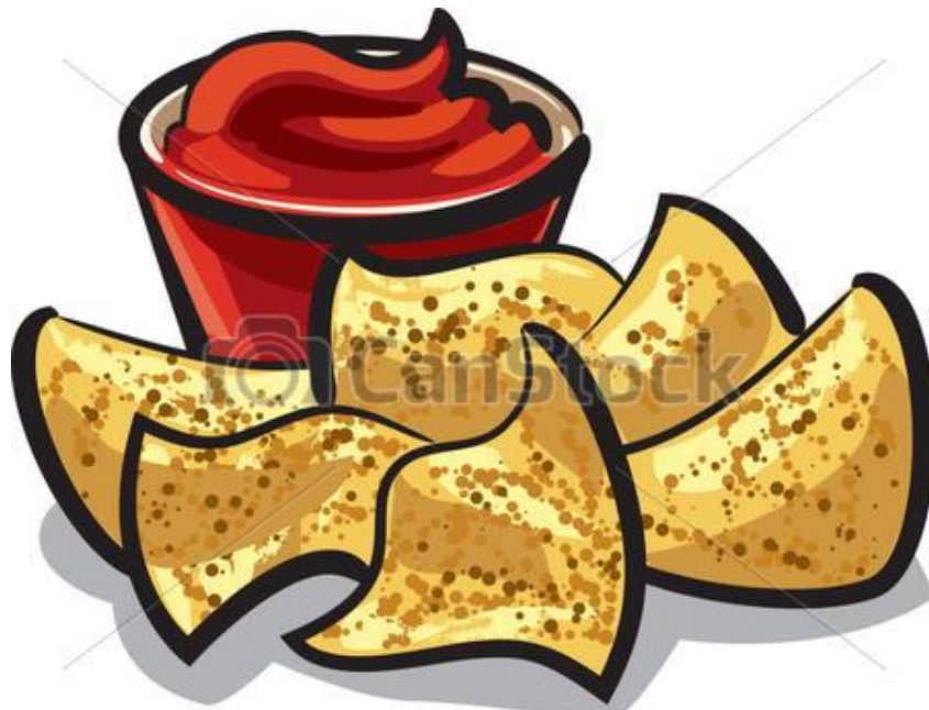
Nachos con salsa picante