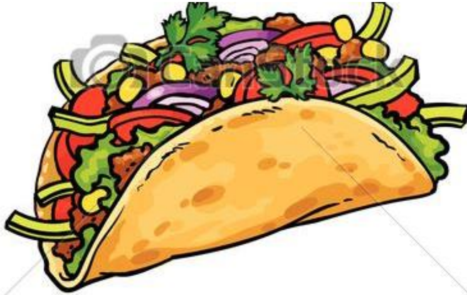
Tortillas de maíz