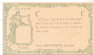
Décimo del sorteo de 1899

■ El primer sorteo televisado fue el 21 de diciembre de 1957